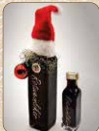
Rotweilikör (ca. 100ml) € 5,-