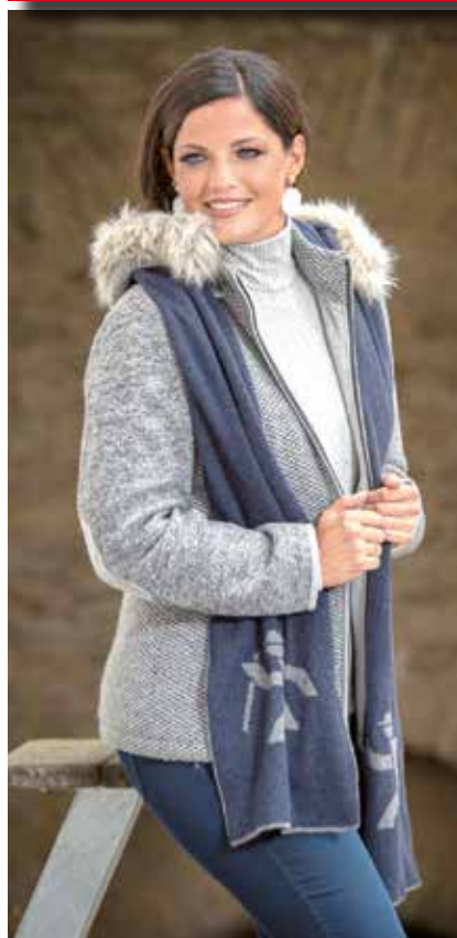
Tr. Outdoorjacke 269,90 / Jogler-Schal 49,90 Tr. Shirt 89,90 / Jeans ab 89,95