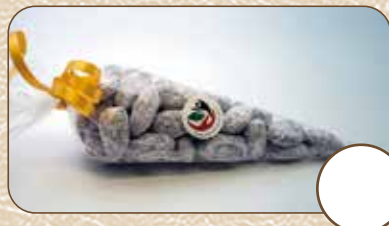
Schneemandeln (ca. 80g) € 5,-