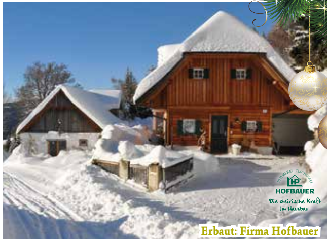
Erbaut: Firma Hofbauer