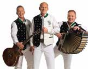
Benefizkonzert: „EDLSEER Weihnacht“ am 7.12.