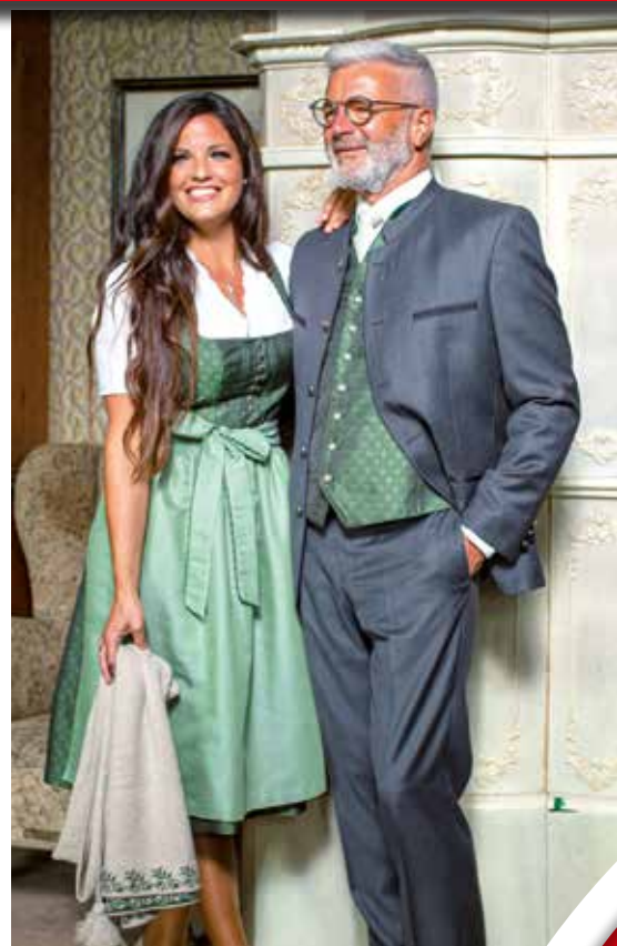
Tr. Poncho 119,90 / festl. Dirndl 349,- / Bluse 49,90 festl. Anzug 469,- / Tr. Gilet 219,90