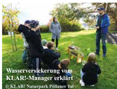
Wasserversickerung vom KLAR!-Manager erklärt

M it allen Sinnen wurde der Boden, seine Lebewesen und die Früchte der Streuobstwiesen entdeckt.