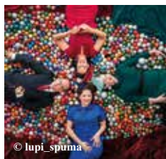
Konzert: Cover Girls am 28.12.

Ein Weihnachtskonzert der Cover Girls, versehen mit Glitzer, Glamour und viel Charme lässt Sie in eine Welt der Harmonie reisen. Mit dem Swing im Blut stellen die drei Cover Girls die wunderbarsten Weihnachts-Klassiker der 20-er bis 40-er Jahre in den Mittelpunkt der fröhlichen Stimmung zum schönsten Fest des Jahres.