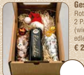
Geschenk-Set Rotweilikör (ca. 250ml) 2 Packungen Mandeln (wie oben) in edler Verpackung € 22,-

Abholung bei Stand am Christkindlmarkt Weiz