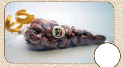
Gebrannte Mandeln (ca. 80g) € 5,-