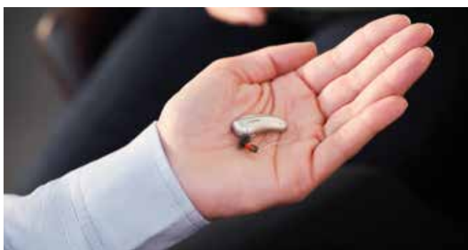
Neu: Audéo Lumity Hörgeräte (Medizinprodukt)