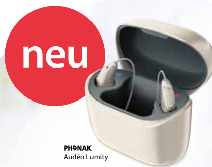
PHONAK Audéo Lumity