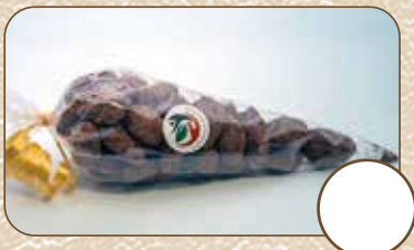
Kakaomandeln (ca. 80g) € 5,-

Bitte gewünschte Menge im Kreis eintragen, fotografieren und per WhatsApp +43 664 1010994 oder E-Mail verein@zukunft-dank-dir.at senden. Danke