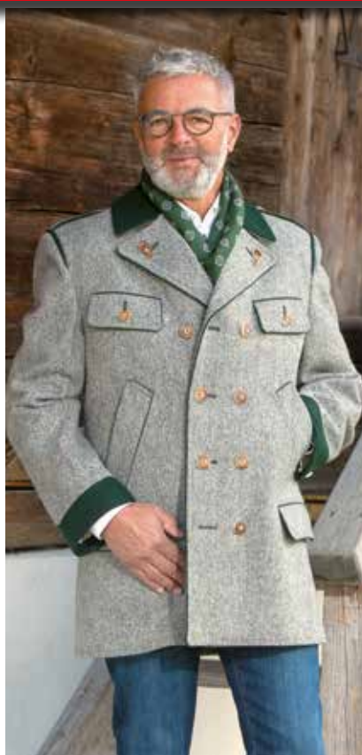
Schladminger 339,- / Jeans ab 69,95 / Schal 49,95